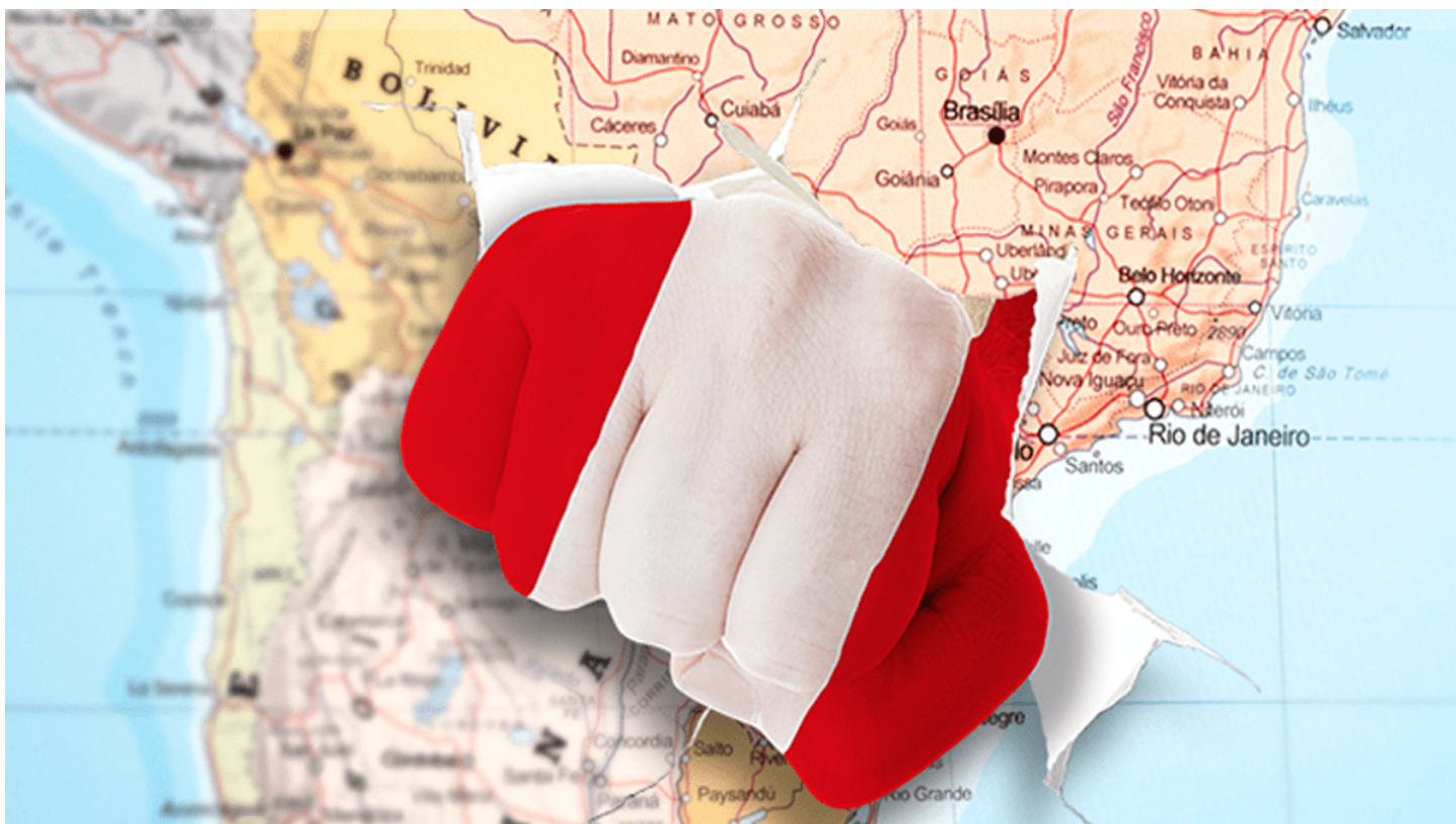
BBC Mundo destaca a Perú por alistar mayor plan de estímulo de América Latina ante pandemia del coronavirus

BBC Mundo resaltó las fortalezas fiscales y monetarias de nuestro país ante la pandemia del coronavirus.