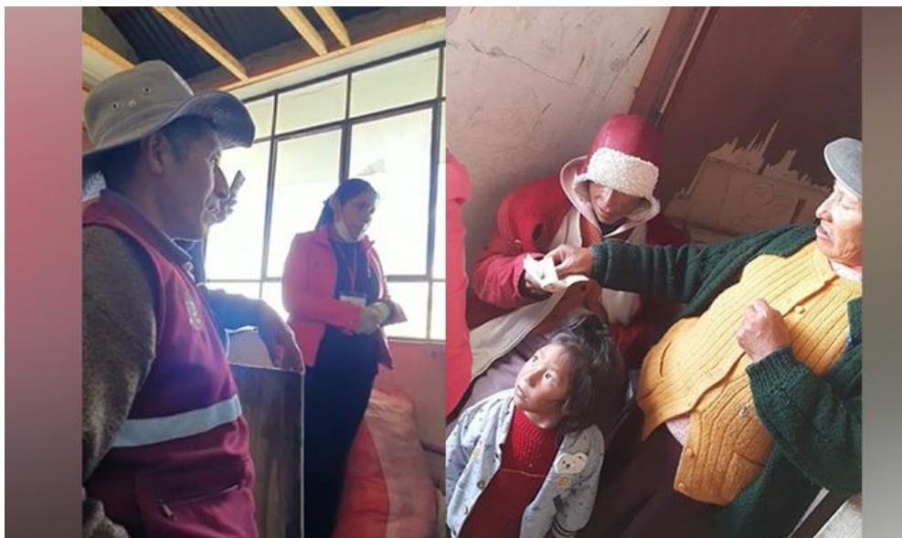
Trabajadora del municipio distrital de Caylloma entregó el dinero a la familia.