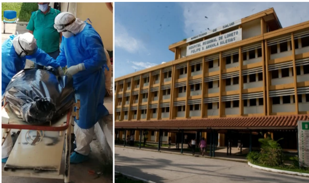
Hospital Regional de Iquitos está colapsado en la segunda región con más casos de COVID-19. Foto: Composición