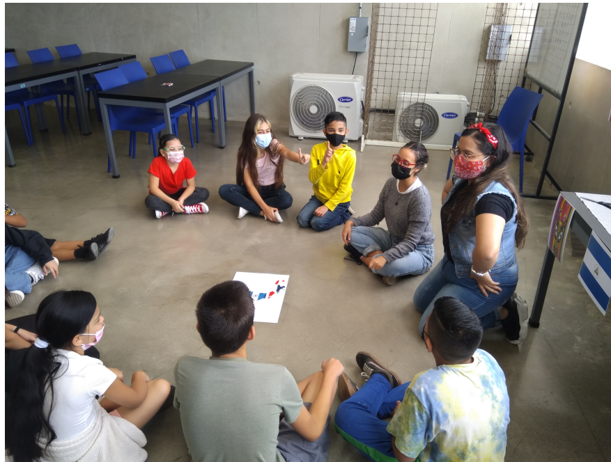
Taller de estudiantes del TCU sobre

Escritorio en el que realicé teletrabajo por dos años en mi casa.